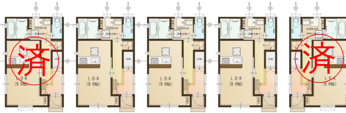
E棟 D棟 C棟 B棟 A棟