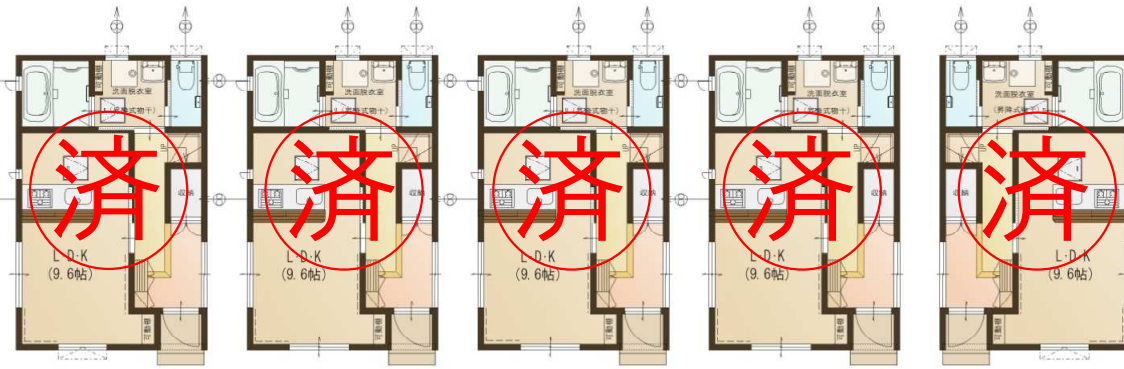
E棟 D棟 C棟 B棟 A棟